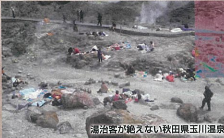
湯治客が絶えない秋田県玉川温泉

北投石は世界でも、秋田県玉川温泉と台湾の北投温泉の二か所からしか産出されません。天然記念物の為、採取できず希少な石です。玉川温泉は国内屈指の湯治場。昭和年代にテレビで幾度も報道され反響を呼び最近では2018年6月にNHKドキュメンタリー「秋田"いのちの温泉"に集う人々」が放映されました。